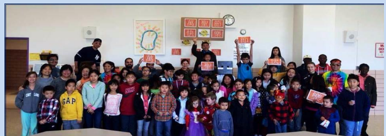
Learning Chinese While Having Fun - Halloween Celebration at OCCS on 31-Oct-2015